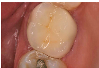
מצב סופי: שן 26 עם כתר PFM