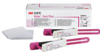
Ketac™ Cem Plus Clicker Refill (56930)