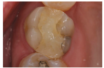
מצב התחלתי: שחזור קומפוזיט לקוי וזיהוי סדק במימד המזיו-דיסטלי בשן 26