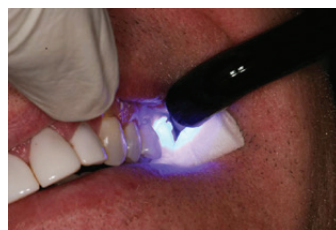
הנחת הכתר על השן המוכנה והקשיית קיבוע באיזור שולי הכתר למשך 5 שניות