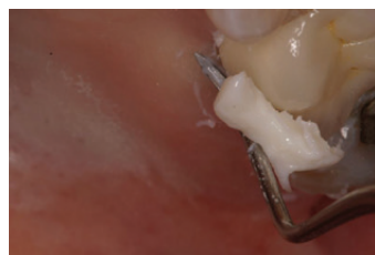
הסרה קלה של שאריות הצמנט בשוליים