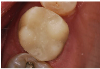
הדבקה זמנית של שחזור מעבר מביס-אקריל 3M™ Protemp™ 4