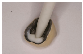
מילוי כתר PFM עם הצמנט הקבוע 3M™ Ketac™ Cem Plus Automix